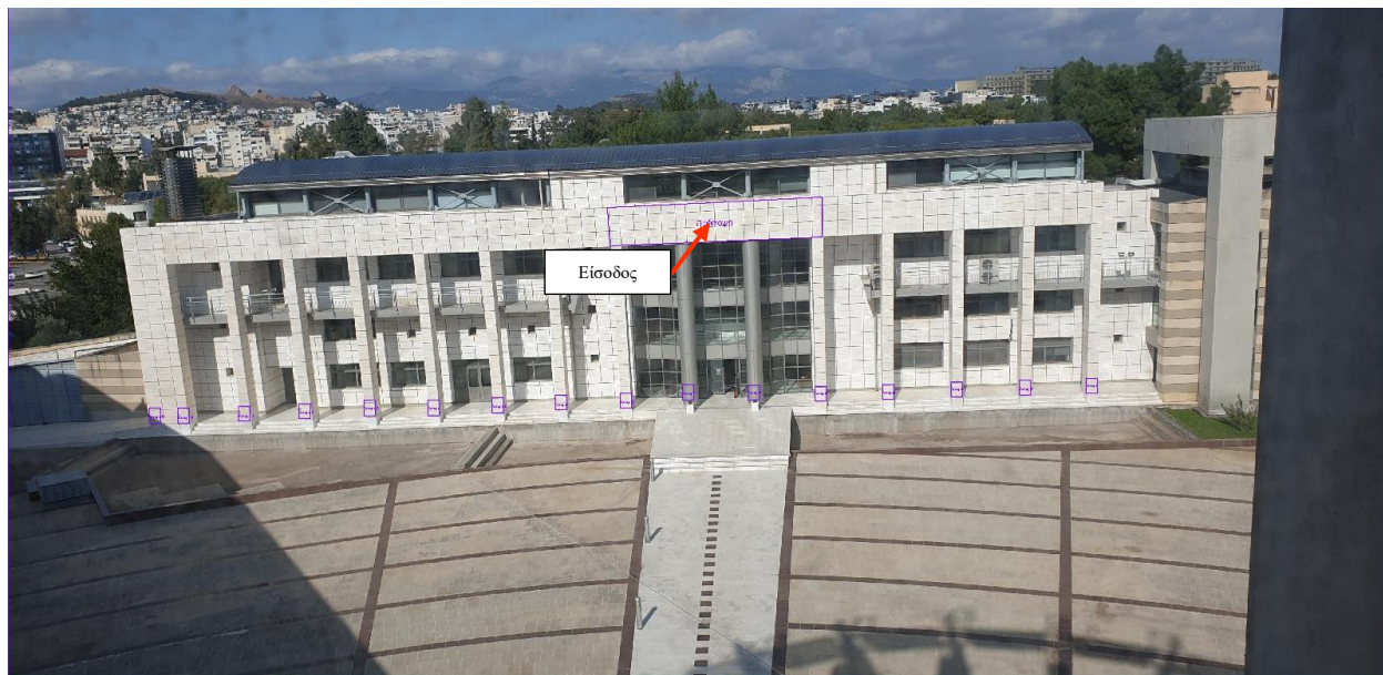
Όψη Ε4 : Σημεία επεμβάσεων